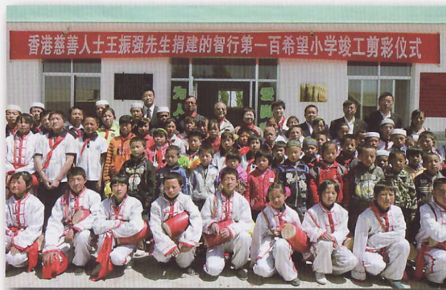
智行第一百希望小學剪彩儀式 甘肅高台縣駱駝城鄉

從 1991 年至今，智行會已在內地資助興建超過一百所學校，涉資金額逾 3,000 萬元。本會為香港註冊慈善團體，接受各界人士捐助。經智行會捐助興建之內地山區學校均經過嚴格篩選，在確定援助項目前，我們均會對學校進行實地視察，以確保受助學校有實際援助需要。