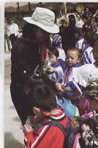
派發小禮品 甘肅山丹縣馬場四場小學

本會歡迎有志為內地教育事業作出貢獻，願意自費到內地山區進行義務工作的朋友與我們聯絡。